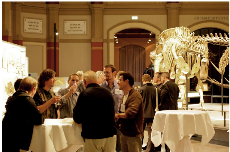
Lustige Gespräche in uriger Atmosphäre