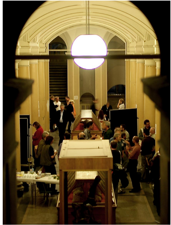
Alte Bekannte treffen sich wieder; Fotos: Benjamin Nitsche

Der Samstag Abend klang bei einem gemeinsamen Abendessen im nahe gelegenen Restaurant „Porta Nova“ aus. Bei gutem Essen und zahlreichen Getränken konnten all die Gespräche zu Ende geführt werden, die tagsüber nicht vollendet worden waren. Auch an diesem Abend zeigte sich, dass Arachnologen auch beim gemütlichen Teil einer Tagung bemerkenswerte Ausdauer besitzen. Einige Tagungsteilnehmer zog es danach noch hinaus, die Hauptstadt bei Nacht kennen zu lernen. Ob die