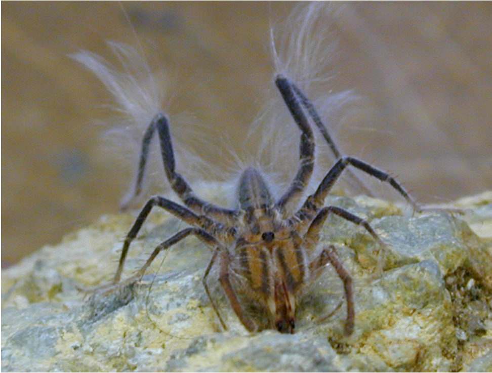
Siegerbild des Photowettbewerbs, fotografiert von Tharina Bird, National Museum Windhoek, Namibia (Solifuge – Walzenspinne in Namibia)

meisten Vorträge gingen um faunistische Erkenntnisse, einige waren auch spezialisiert auf bestimmte Familien wie Atypidae, Araneidae, Corinnidae, Sicariidae, Hersiliidae, Theridiidae, Ammoxenidae, Dysderidae, Sparassidae und Salticidae.